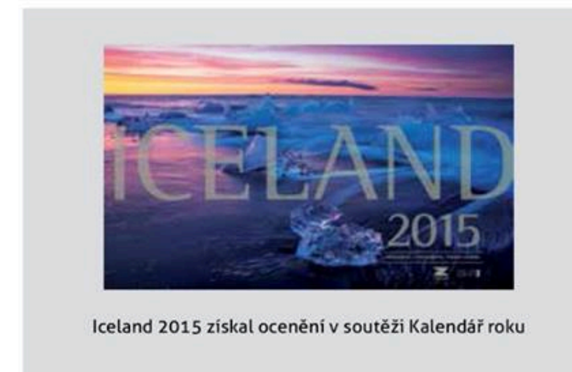
Iceland 2015 získal ocenění v soutěži Kalendář roku